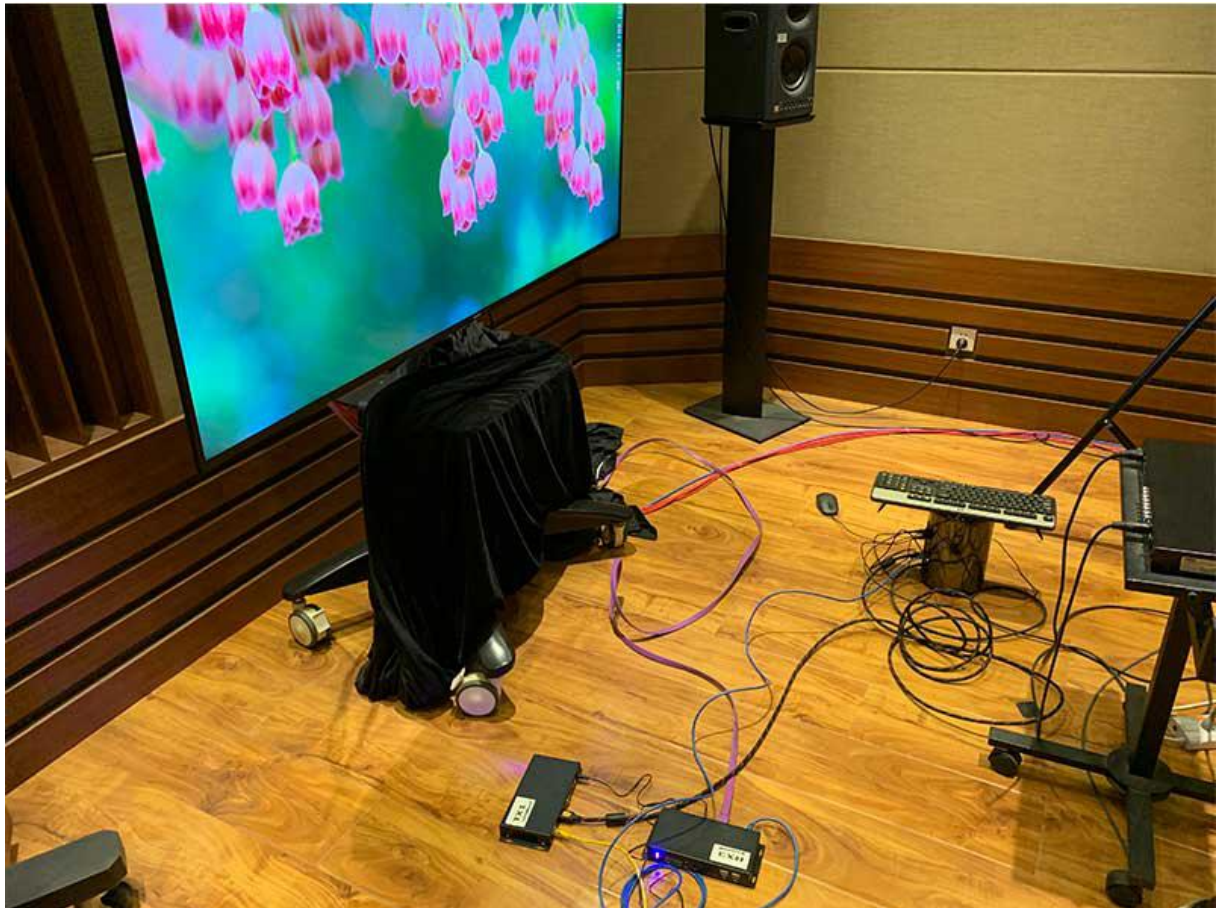
连接成功，完美显示 4K