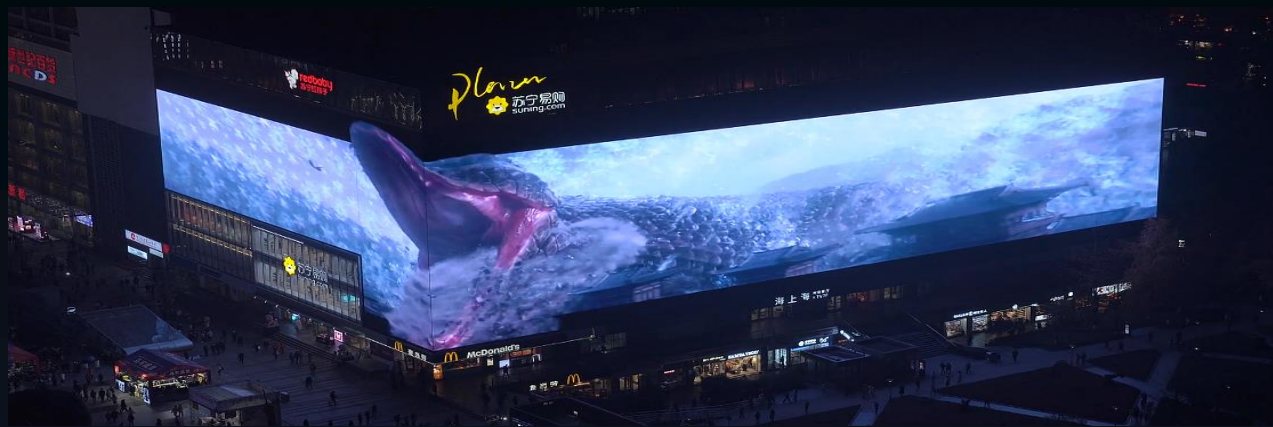
户外大屏解决方案