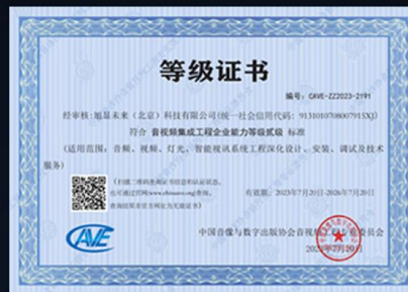
音视频二级等级证书