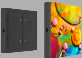
旭显|户外大屏 XFM Max-LED