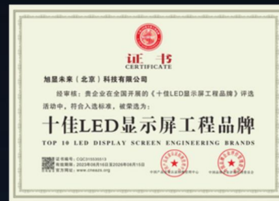
十佳LED显示屏工程品牌