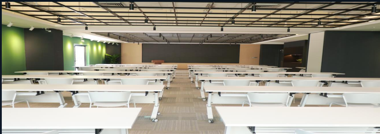
智慧校园解决方案