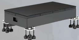
旭显|地砖屏 XFM Board-A