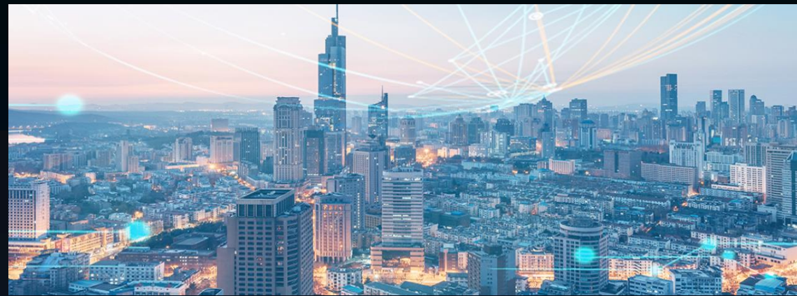
智慧城市解决方案