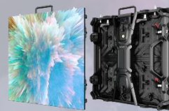
旭显|租赁屏 XFM Flash-1