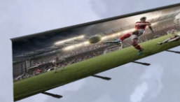
旭显|球场屏显 XFM Sport-X