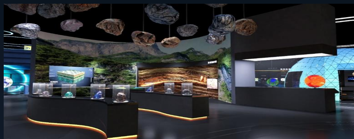
展览展示解决方案