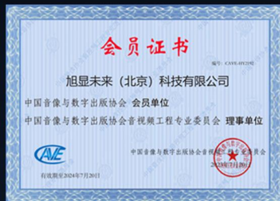
中国音像协会会员证书