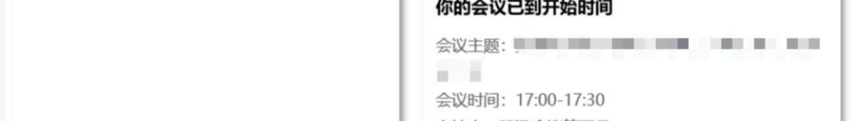
报名成功的用户可直接入会，非入会用户入会时需要报名