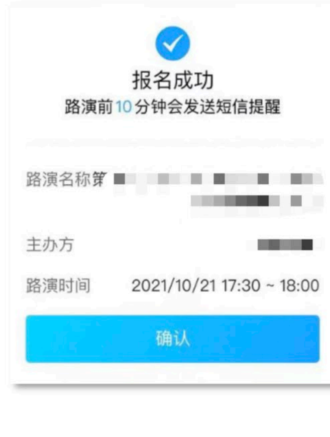
客户报名比对白名单自动报名成功